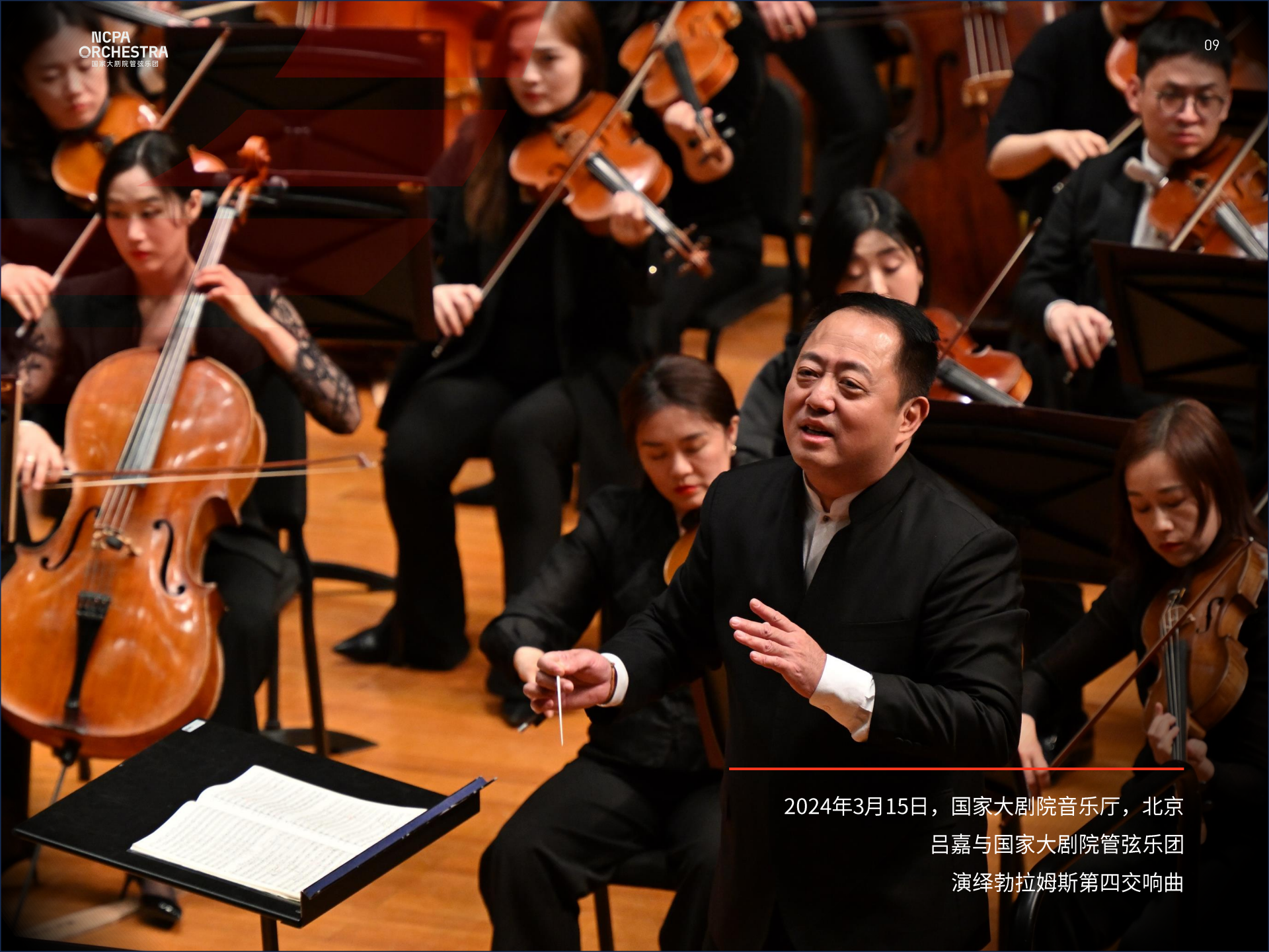
2024年3月15日，国家大剧院音乐厅，北京 吕嘉与国家大剧院管弦乐团 演绎勃拉姆斯第四交响曲